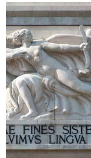
Figura de n'èila cun eles che tira na sëita, bas-relief dl artist Arturo Dazzi, sun l fruent a est dl Monumènt y pert dl'iscrizions per latin

L dom de Bulsan danejà dai bombardamènc dla Segonda viera mundiela, 1943/44